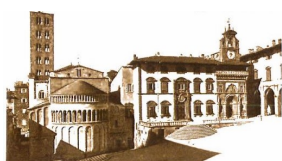
Camera Civile di Arezzo Aderente all'Unione Camere Civili